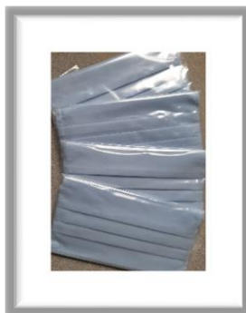
EE Labels, Heeze doneert 7 x 900 mondkampjes

https://www.thefinderonline.com/news/item/21589-sossah-st-anthony-s-hospital-call-to-intensify-education-on-covid-19-fight